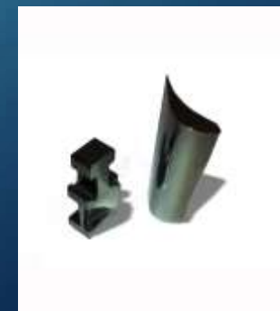
PALETTE PER TURBINA A VAPORE