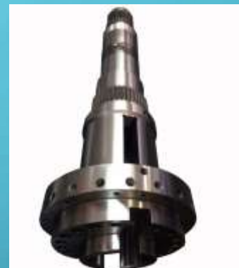
ALBERO MANDRINO MACCHINA UTENSILE

QUESTI SONO ALCUNI PRODOTTI CHE L'AZIENDA OFFRE