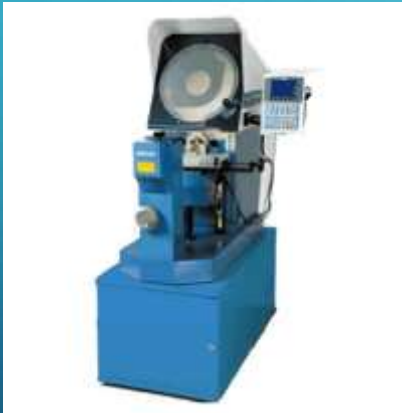
Mitutoyo Proiettore di profili PH-A14

Per ampliare e migliorare il controllo qualità dei particolari prodotti è stata allestita una sala metrologica moderna e tecnologicamente avanzata nella quale oltre ai tradizionali strumenti di misura si aggiungono: