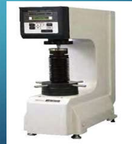
Durometro Mitutoyo HR-320MS