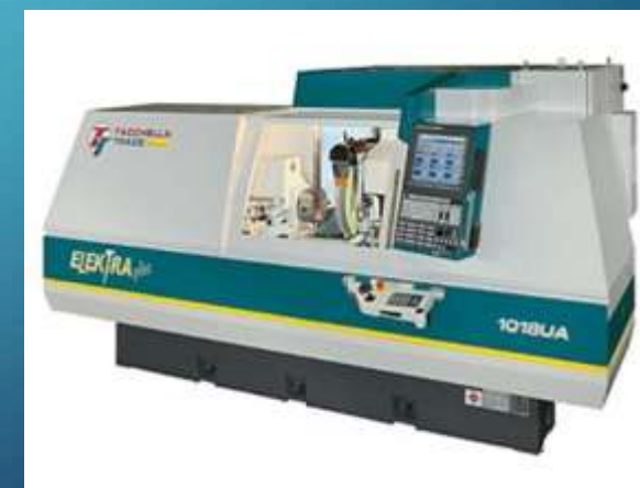
RETTIFICA ELEKTRA PLUS TACHELLA