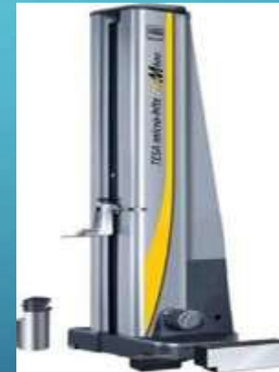
Altimetro TESA MICRO-HITE PLUS 600