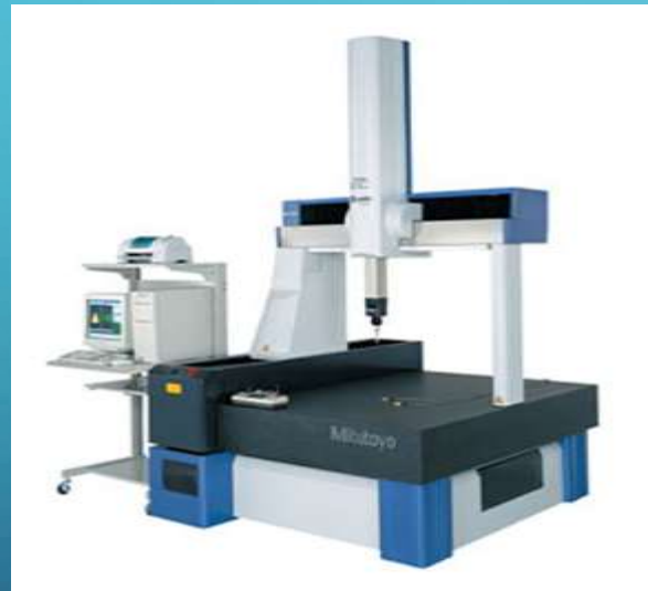
Mitutoyo Roundtest RA-120