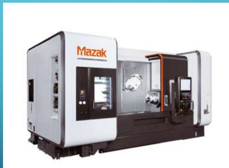
Mazak Integrex 400-IV