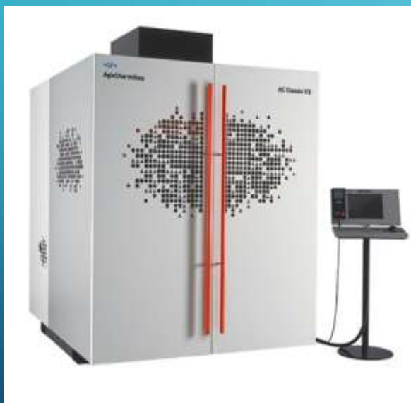
Elettroerosione AC Classic V3

Il parco macchine delle officine SEFA quasi completamente macchinari a controllo numerico per eseguire le più disparate operazioni dalla tornitura alla finitura, tra cui i seguenti macchinari: