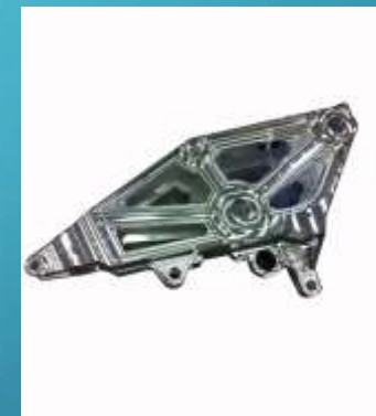
COMPONENTE PLAS PER AEREAUTICA